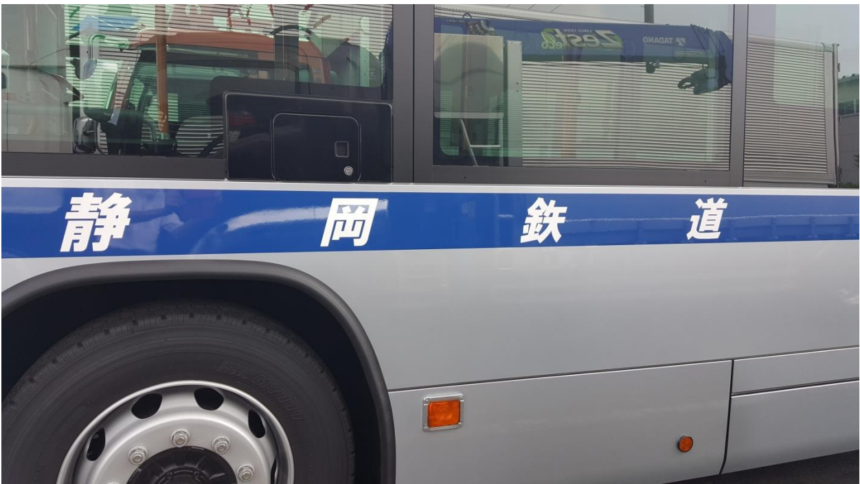
伝統の青帯に白字「静岡鉄道」