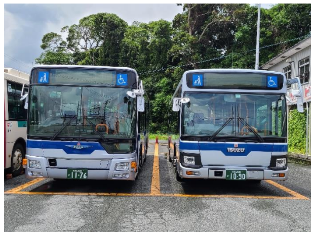
2 台の銀バスを並べて…