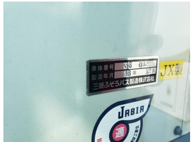
車体番号 36 0822 製造年月 16年 12月