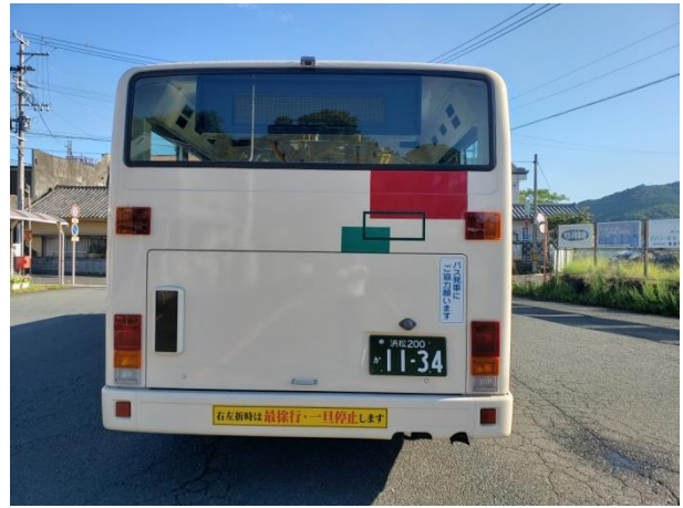
敢えて前の小窓は残してあります。