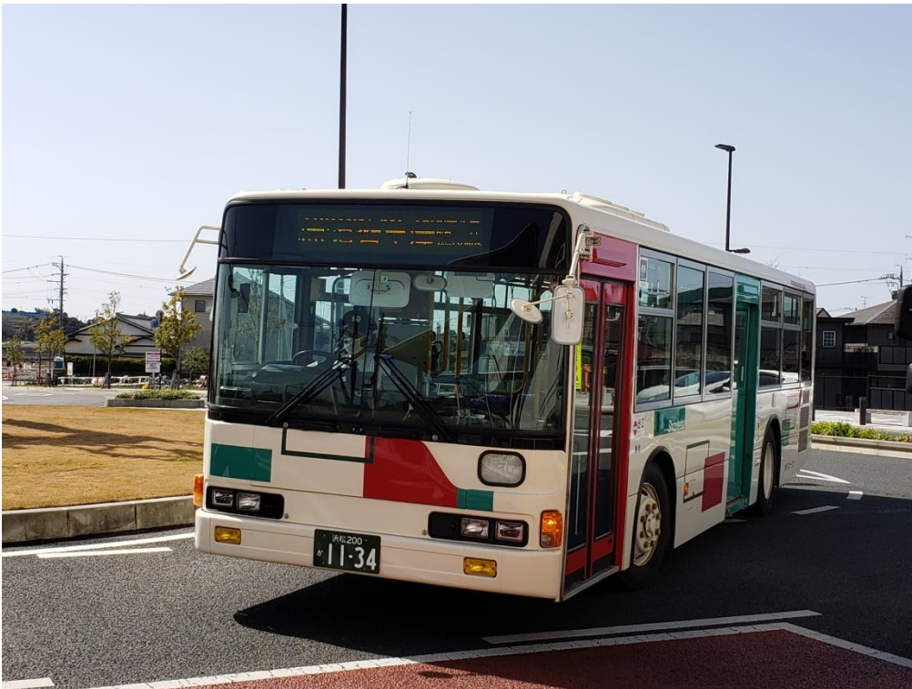
秋葉バスサービス株式会社