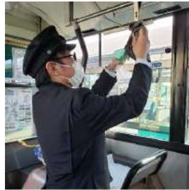
バス車内の消毒作業