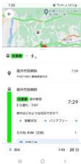
Google マップにおけるリアルタイム情報

*Google における時刻検索や Google マップ上において、遅延情報などリアルタイム情報を発信できる体制を整え、お客様への情報の発信に努めました。