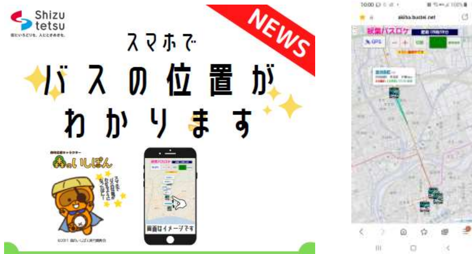
お知らせと秋葉バスロケ画面(スマホ版)

*全停留所に QR コードを掲示し、お客様が運行状況を確認できる体制を整えました。