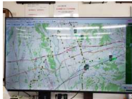
事務所内大型モニター